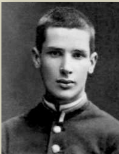
Ученик Виленской гимназии. Фото 1876 года

Столыпин уезжает в Санкт-Петербург, где 31 августа 1881 года поступил на естественное отделение (специальность — агрономия) физико-математического факультета Санкт-Петербургского Императорского университета. Во время обучения Столыпина в университете одним из преподавателей университета был знаменитый русский учёный Дмитрий Менделеев. Он принимал у него экзамен по химии и поставил «отлично».