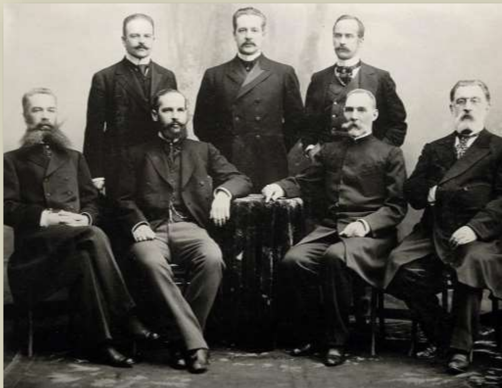
Столыпин в Ковно с уездными предводителями дворянства Ковенской губернии. Фото 1901 года